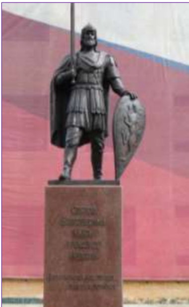
Фото и подробнее здесь >>

Композиция смонтирована на центральном из стоящих в ряд трех куполах.